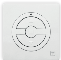
TÉLÉCOMMANDE INDIVIDUELLE MURALE ONE-T